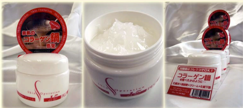
◎製品にはシュリンクパック がされております。